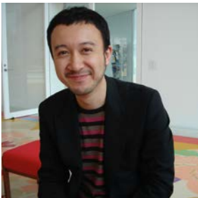
TAJI FUJIMORI ATELIER 藤森 泰司 / 家具デザイナー www.taiji-fujimori.com